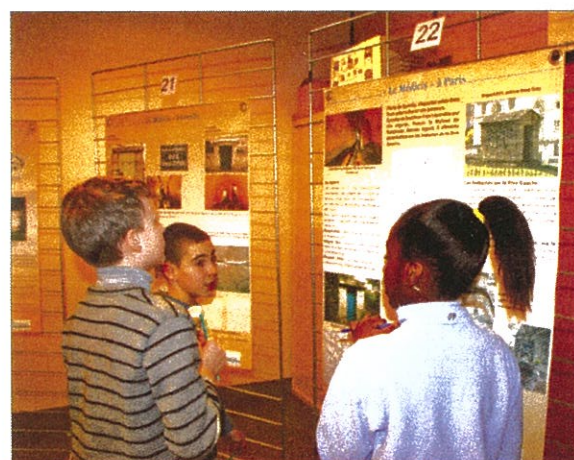
Les enfants des classes rungissoises ont visité l'exposition lors de son passage à Rungis. Un petit jeu leur était proposé.