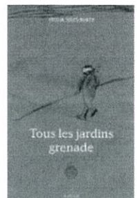
Tous les jardins grenade

Très joliment écrites par la Fresnoise Cécilia Jules-Burth, les 13 nouvelles de ce recueil font se côtoyer réalisme, poésie et personnages hauts en couleurs. ■ Ouvrage disponible chez JS Éditeur, 9 allée des Lilas à Fresnes. Tél. 06 14 30 84 85.