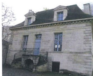
La maison du fontainier, le plus ancien édifice de l'arrondissement. (L.P./P.B.)

M éconnue, la maison du fontainier, située 42, avenue de l'Observatoire (XIV e ), est le plus beau vestige parisien de l'aqueduc que Marie de Médicis fit construire au début du XVII e siècle pour amener l'eau de Rungis (Val-de-Marne) jusqu'à Paris. Si l'ouvrage long de 13 km permet de fournir de l'eau potable aux habitants de la rive gauche, il était aussi et surtout destiné à alimenter les fontaines et pièces d'eau dont la régente, mère du jeune Louis XIII, voulait orner sa résidence qui deviendra le palais du Luxembourg, aujourd'hui siège du Sénat. Erigé de 1613 à 1623 par 500 ouvriers, l'aqueduc dont la première pierre fut posée à Rungis le 17 juillet 1613 par Louis XIII alors âgé de 12 ans, fêtera l'an prochain ses 400 ans. A Paris, l'anniversaire sera célébré par un week-end de visites organisées par l'association Paris historique les 15 et 16 juin. Construite en 1619, la maison du fontainier dont